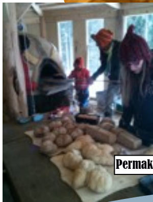
Permakultur ist harte Arbeit, die sich lohnt!