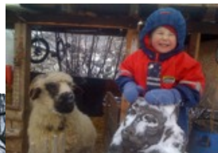
Projecto Lashaia „Mit Schafen wachsen...“