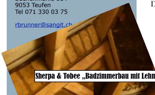
Sherpa & Tobee „Badzimmerbau mit Lehm“

Text von Cornelia Rose aus dem Buch Gemeinsam unterwegs